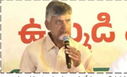
అమరావతి: 'రాష్ట్ర ప్రజల సంక్షేమం, అభివృద్ధిని కాంక్షించే మ్యూనిసిపాలిటీ మీ ముందు పెట్టాం. తెదేపా, భాజపా, జనసేన అభ్యర్థులకు ఓటు వేసి గెలిపించండి'

అని చంద్రబాబు విజ్ఞప్తి చేశారు. కూలమి మ్యూనిసిపాలిటీ విరుదల సందర్భంగా ఆయన మాట్లాడారు. "పథకాలకు ఎక్కడినుంచి నిధులు వస్తాయని అంటున్నారు. జగన్ ఎక్కడి నుంచి తెచ్చారు.. సాక్షి నుంచి తెచ్చారా? భారత్ సిమెంట్ అమ్మి తెచ్చారా? 2019లో వనరులు సమర్పవంతంగా వినియోగించుకొని సంపద సృష్టించాం. ఆరోజు వచ్చిన కిరూ మోటార్స్ ఉదాహరణగా తీసుకోండి. గొల్లపల్లి రిజర్వాయర్ కట్టి కిరూ మోటార్స్ ఏర్పాటు చేశాం. ఇప్పటివరకు 12 లక్షల కార్లు ఉత్పత్తి అయి ప్రపంచం మొత్తం తిరుగుతున్నాయి. 12వేల మంది ప్రత్యక్షంగా పనిచేస్తున్నారు. దాదాపు 30వేల కుటుంబాలు ఉపాధి పొందుతున్నాయి. ప్రభుత్వానికి ఏడాదికి రూ.వెయ్యి కోట్ల ఆదాయం వస్తోంది. ఆ డబ్బులతో సంక్షేమ