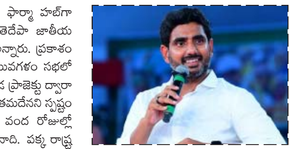
పెట్టారం. మానసికంగా ఇబ్బందులు పెడుతున్నారు. వైకాపా చేసిన తప్పులను ప్రజల ముందుంచాం. సమర్థ నాయకత్వం అందించే అభ్యర్థులను గెలిపించాలి. తప్పు చేసిన అధికారులను ఉపేక్షించేది లేదు. చట్టాలను కొంత మంది చుట్టూలా మార్చారు. చట్టాలను ఉల్లంఘించిన అధికారులను వదిలిపెట్టేది లేదు. వారి పేర్లు రెడ్ బుక్ లో ఉన్నాయి. అభివృద్ధి ద్వారా వచ్చే ఆర్థిక వనరులను పేదలకు ఖర్చు పెడతాం. తెదేపా హయాం నాటి పథకాలను వైకాపా రద్దు చేసింది. రద్దు చేసిన సంక్షేమ కార్యక్రమాలను తిరిగి ప్రారంభిస్తాం" అని లోకేశ్ భరోసా కల్పించారు.