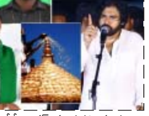
కుంభాభిషేకం చేస్తే జగన్ కు పదవి గండం ఉందని కొందరు జ్యోతిష్యులు చెప్పడంతోనే ఆ పని చేయలేదని చెప్పారు పవన్ కళ్యాణ్. శివుడు మూడో కన్ను తెరిస్తే భస్మమై పోతారని, మిరతం మీ స్థాయి ఎంత అంటూ నిప్పులు చెరిగారు. తరాలుగా వస్తున్న ఆచారాలను తుంగలో తొక్కి స్వార్థ ప్రయోజనాల కోసం వైసీపీ చాలా చేసిందని అది దేవుడైన శివుడికి అగ్రహం వస్తే శివుడు మూడో కన్ను తెరిచి వైసీపీని నిలుపునా కాల్చేస్తారని పవన్ కళ్యాణ్ హెచ్చరించారు. శ్రీశైలం మల్లన్నకు స్వామి మహా కుంభాభిషేకం చేయడం వాయిదా వేయడానికి కారణమైన వారు సర్వనాశనం అవుతారంటూ వ్యాఖ్యలు చేశారు. శ్రీశైలం మల్లన్నకు స్వామి మహా కుంభాభిషేకాన్ని పక్కన పెట్టిన మీరు సర్వనాశనం అవడం భాయం అంటూ పేర్కొన్నారు. ఈ ప్రభుత్వం నూటికి నూరుపాళ్లు అధికారంలోకి రాకుండా పోతుంది అంటూ పవన్ కళ్యాణ్ వ్యాఖ్యలు చేశారు.

అమరావతి : ఆంధ్రప్రదేశ్ రాష్ట్రంలో రాజకీయాలు ఎన్నికల సమయం దగ్గర పడుతున్న తరుణంలో కాక రేపేతున్నాయి. ఎన్నికల ప్రచారాన్ని నిర్వహిస్తున్న అన్ని రాజకీయ పార్టీల నేతలు తాము అధికారంలోకి వస్తే ఏం చేస్తామో చెబుతూ ఎన్నికల ప్రచారాన్ని చేస్తూనే, ప్రత్యర్థి పార్టీల నాయకులపై తీవ్ర స్థాయిలో విరుచుకుపడుతున్నారు. అంతేకాదు ఇదే సమయంలో ఊహించని విధంగా సంవలన వ్యాఖ్యలు కూడా చేస్తున్నారు. తాజాగా వైసీపీ అధినేత, ఏపీ సీఎం జగన్మోహన్ రెడ్డి పై జనసేన అధినేత పవన్ కళ్యాణ్ సంవలన వ్యాఖ్యలు చేశారు. ఏపీలో అధికారం కోసం జగన్ జ్యోతిష్యులను కూడా సమర్థిస్తున్నారని, వారు చెప్పిన ప్రకారమే ఆయన ప్రవర్తిస్తున్నారని ఆరోపించారు. ఈ క్రమంలోనే శ్రీశైలం మల్లన్నకు పదవి గండం తరతరాలుగా వస్తున్న మహా కుంభాభిషేకం చేయకుండా దేవాదాయ శాఖ మంత్రి కొట్ల సత్యనారాయణ రెండు సార్లు వాయిదా వేశారన్నారు. కారణం ఏం చెప్పాలో తెలియక ఎండలు బాగా ఉన్నాయని చేయడం లేదని చెప్పారని అయితే అసలు విషయం అది కాదన్నారు పవన్ కళ్యాణ్. శ్రీశైలంలో దక్షిణాయణం లో మల్లన్నకు స్వామి కి మహా