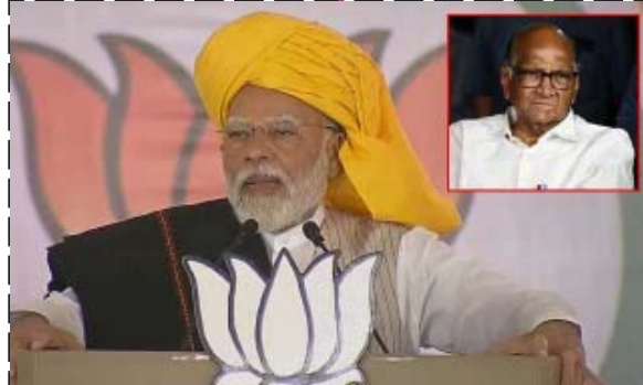
ఇతరులు చేసిన మంచిని కూడా చెడగొడుతుంది. దాని చర్యలకు మహారాష్ట్ర ఓ ఆధిత ప్రదేశం" అని ఆయన వ్యాఖ్యానించారు. ఓట్లను వృథా చేసుకోవద్దా..

ముంబయి: ఆయనకు విజయం లభించకపోతే.. ఇతరుల మంచి పనులను కూడా శరద్ పవార్ చెడగొడతారని ప్రధాని నరేంద్ర మోడీ ఆరోపించారు. మహారాష్ట్రలోని షోలాపూర్ జిల్లా మల్లిరాస్ లో ఏర్పాటు చేసిన ఎన్నికల కార్యాలయంలో పాల్గొన్న సందర్భంగా ఈ వ్యాఖ్యలు చేశారు. వ్యవసాయానికి ఏపీఎం చేయలేదని ఎన్డీపీ (ఎన్డీ) అధినేత పై ప్రధాని విమర్శనాస్త్రాలు ఎక్కువెత్తారు. మహారాష్ట్రలోని అగ్రనాయకుడు ఒకరు కేంద్ర వ్యవసాయశాఖ మంత్రిగా చేసిన రోజుల్లో రైతుల అభివృద్ధి కోసం ఎలాంటి కృషి చేయలేదని పవార్ ను ఉద్దేశించి మోడీ పరోక్షంగా విమర్శించారు. వారు అధికారంలో ఉన్నప్పుడు బకాయిల కోసం రైతులు చెరకు కమిషన్ చుట్టూ ప్రదక్షిణలు చేయాల్సి వచ్చిందన్నారు. "రాష్ట్రంలో ఓ ఆత్మ సంపదస్తోంది (శరద్ పవార్ ను ఉద్దేశిస్తూ). దానికి విజయం దక్కకపోతే