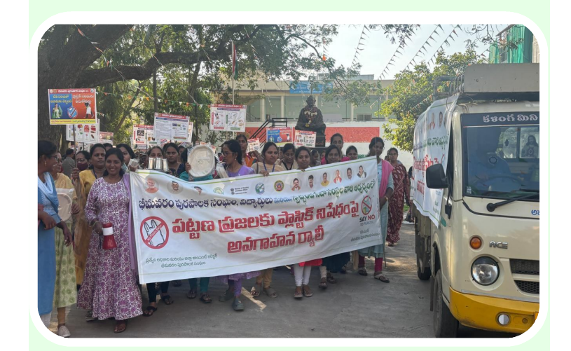
భీమవరం పురపాలక సంఘం పలిథిలో ప్లాస్టిక్ క్యాలీ బ్యాగులు మలియు సింగిల్ యూజ్ ప్లాస్టిక్ వస్తువుల అమ్మకం మరియు వాడకంపై అమలు