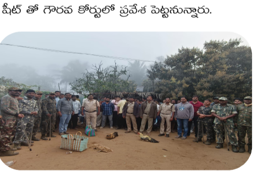
పీటీ తో గౌరవ కోర్టులో ప్రవేశ పెట్టినన్నారు.