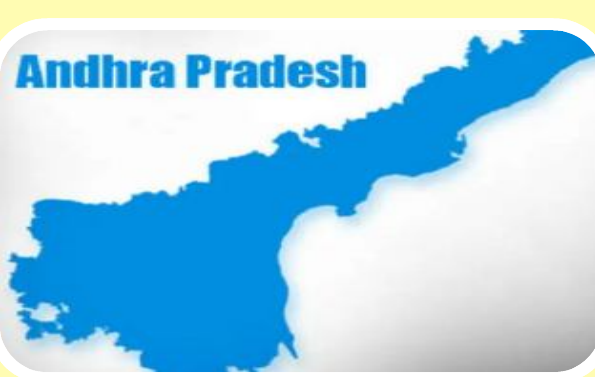
కింద రాష్ట్రంలోని అల్లూరి సీతారామరాజు జిల్లాలో ఉన్న 15

నిధుల్లేకుండా అల్లాడిన పంచాయతీలకు రెగ్యులర్ గా కేంద్రం ద్వారా తీసుకుని మరీ నిధులు ఇస్తున్నారు. ఇదే క్రమంలో పంచాయతీల బలోపేతానికి మరో కేంద్ర ప్రభుత్వ పథకంలో వాటిని భాగస్వామిని చేశారు. దీంతో ఆయా పంచాయతీల్లో సమగ్రాభివృద్ధి జరగబోతోంది.కేంద్ర ప్రభుత్వం పంచాయతీల్లో సమగ్రాభివృద్ధి కోసం వికసిత పంచాయత్ కర్మయోగీ పథకాన్ని ప్రయోగాత్మకంగా అమలు చేస్తోంది. ప్రస్తుతం బీజేపీ పాలిత రాష్ట్రాలైన గుజరాత్, అస్సాం, ఒడిశాల్లో మాత్రమే అమలువుతున్న ఈ పథకాన్ని పవన్ చొరవతో ఇప్పుడు ఏపీకి సైతం విస్తరించారు. కేంద్ర ప్రభుత్వానికి చెందిన కెపాసిటీ బిల్డింగ్ కమిషన్ ఈ మేరకు నిర్ణయం తీసుకుంది. ఈ కార్యక్రమం