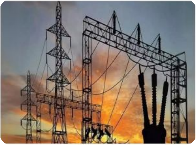
పెట్టింది ఏపీ విద్యుత్ నియంత్రణ మండలి.