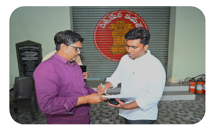
కాకినాడ (రాయల్ జర్నలిజం) ఫిబ్రవరి 25 :

ఈవీఎం, వీవీపాట్స్ (ఎలెక్షానిక్ ఓటింగ్ మిషన్) భద్రతకు తగు చర్యలు చేపట్టాలని జిల్లా కలెక్టర్ షణ్మోహన్ అధికారులను ఆదేశించారు. మంగళవారం కాకినాడ కలెక్టర్ కార్యాలయం వద్దనున్న ఈవీఎం గోదామును జిల్లా కలెక్టర్ షణ్మోహన్.. రెవెన్యూ, ఎన్నికల అగ్నిమాపక, పోలీస్ శాఖల అధికారులతో కలిసి తనిఖీ చేశారు. ఈవీఎం గోదాము