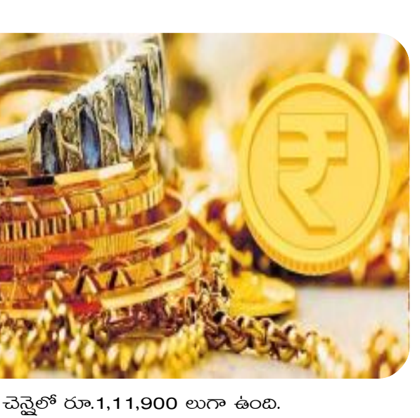
చెన్నైలో రూ.1,11,900 లుగా ఉంది.

ముంబైలో 22 క్యారెట్ల ధర రూ.82,690, 24 క్యారెట్ల ధర రూ.90,210 గా ఉంది. చెన్నైలో 22 క్యారెట్ల ధర రూ.82,690, 24 క్యారెట్ల రేటు రూ.90,210 గా ఉంది. బెంగళూరులో 22 క్యారెట్ల ధర రూ.82,690, 24 క్యారెట్ల ధర రూ.90,210 గా ఉంది. వెండి ధరలు.. హైదరాబాద్‌లో కిలో వెండి ధర రూ.1,11,900 విజయవాడ, విశాఖపట్నంలో రూ.1,11,900 ఢిల్లీలో వెండి కిలో ధర రూ.102,900 లుగా ఉంది. ముంబైలో రూ.102,900 గా ఉంది. బెంగళూరులో రూ.102,900లుగా ఉంది.