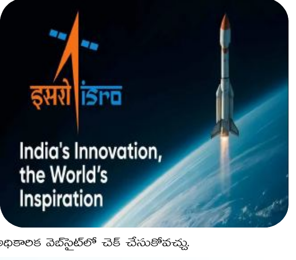
అధికారిక వెబ్సైట్లో చెక్ చేసుకోవచ్చు.

ఏళ్ల లోపు వయసు ఉండాలి. ఓబిసీలకు మూడేళ్లు, ఎస్సీ, ఎస్టీ అభ్యర్థులకు ఐదేళ్లు, దివ్యాంగులకు పదేళ్ల వరకు వయోపరిమితిలో సడలింపు ఉంటుంది.ఆసక్తి కలిగిన వారు ఆన్లైన్ ద్వారా ఏప్రిల్ 20, 2025వ తేదీలోపు దరఖాస్తు చేసుకోవచ్చు. ఎలాంటి రాత పరీక్ష లేకుండానే ఇంటర్వ్యూ ఆధారంగా ఎంపిక చేస్తారు. ఎంపికైతే జూనియర్ లిసెన్స్ ఫెలోకు నెలకు రూ.37,000, లిసెన్స్ అసోసియేట్కు నెలకు రూ.58,000 చొప్పున ప్లెవెండ్ ఇస్తారు. ఇతర వివరాలు