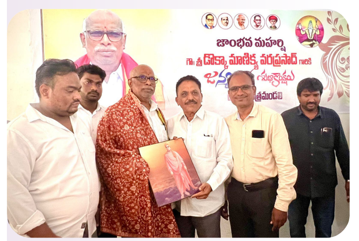
గుంటూరు (రాయల్ జర్తలిజం)మాల్ట్, 5 : మాజీ