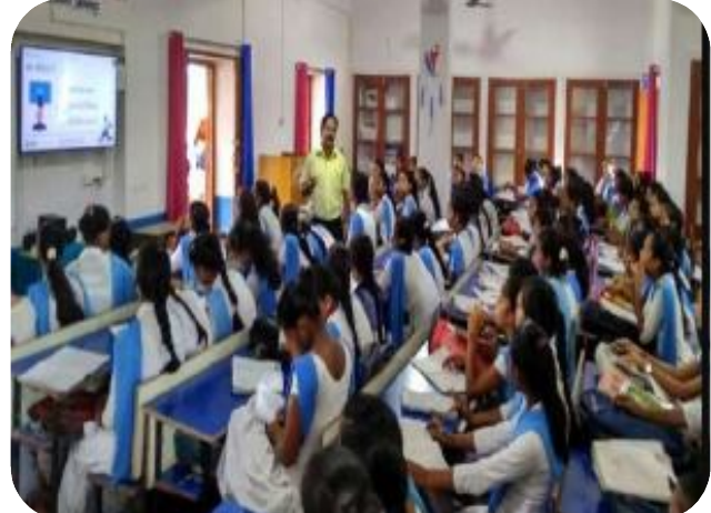
కోసం ట్రాక్లు కూడా నిర్మించే విద్యాశాఖ ప్లాన్ చేస్తోంది. ఈ మేరకు రాష్ట్రవ్యాప్తంగా స్కూళ్లలో పీఈటీలకు ప్రత్యేకంగా శిక్షణ కూడా ఇస్తారు. ముందు ప్రయోగాత్తాకంగా చేపట్టి.. వచ్చే

అవుతుందంటున్నారు. క్రీడలతో విద్యార్థుల్లో ఆత్తవిశ్యాసం పెంపాందుతుందని చెబుతున్నారు.ఈ యాక్టివ్ ఆంధ్ర కార్యక్రమం కోసం ఢిల్లీలోని ప్రభుత్వ స్కూళ్లలో అమలు చేసిన సమూనాపై అధికారులు కసరత్తు చేస్తున్నారు. ముందు ఈ యాళ్టిప్ ఆంధ్ర కార్యక్రమాన్ని వేసవి సెలవుల వరకు ప్రయోగాత్తకంగా మంగళగిలి నియోజకవర్గంలోని నిడమర్రు స్కూల్లో అమలు చేయనున్నారు. అనంతరం విడతల వాలీగా అన్ని ప్రభుత్వ పాఠశాలల్లో అమలు చేయాలని ప్లాన్ చేస్తున్నారు. ఈ మేరకు అధికారులు కసరత్తు చేశారు. ప్రతి రోజూ గంటసేపు క్రీడలకు కేటాయించేలా ప్లాన్ చేస్తున్నారు.రాష్ట్రవ్యాప్తంగా స్కూళ్లలో విద్యార్థులను 5 ఏళ్ల సుంచి 8, 9 ఏళ్ల నుంచి 14, 15 ఏళ్ల నుంచి 19 ఏళ్లుగా విభజిస్తారు. వీలికి ఆసక్తి ఉన్న ఆటలను రోజుతో గంట చౌప్పన ఆడించేలా యాక్టివ్ ఆంధ్ర కార్యక్రమాన్ని ప్లాన్ చేశారు. కబడ్డీ, కోర్బుల్ని కూడా ఏర్వాటు చేయనున్నారు. రన్నింగ్, ఇతర ఆటల