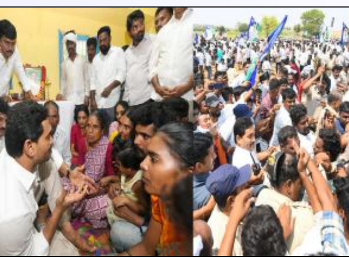
పోలీసులు సరైన భద్రత కల్పించలేదని, కాన్స్టాబుల్