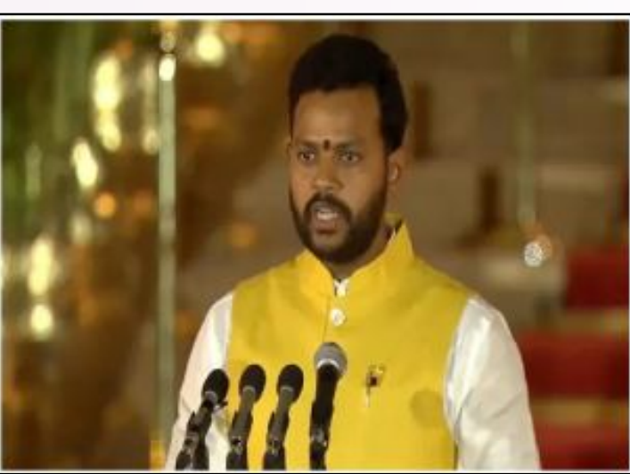
సమస్య ఉంటే నేరుగా రామ్మోహన్ నాయుడుకు ఫోన్ చేసి వివరించాల్సిందని పేర్కొంది. భవిష్యత్ లో ఇలాంటివి లిమిట్