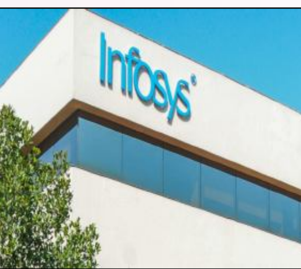
ఉద్యోగుల సంఖ్య మాత్రం స్వల్పంగా పెరిగింది. మార్చి 31, 2025 నాటికి మొత్తం ఉద్యోగుల సంఖ్య 3,23,578కి చేరింది,

'ద మిస్సింగ్ లింక్'ను 98 మిలియన్ డాలర్లకు (సుమారు రూ. 532 కోట్లు) ఇన్ఫోసిస్ సింగపూర్ ప్రైవేట్ లిమిటెడ్ ద్వారా కొనుగోలు చేయనుండగా, అమెరికాకు చెందిన టెక్నాలజీ అండ్ బిజినెస్ కన్సల్టింగ్ సంస్థ 'ఎమ్ఆర్ఈ కన్సల్టింగ్'ను 36 మిలియన్ డాలర్లకు (సుమారు రూ. 307.4 కోట్లు) ఇన్ఫోసిస్ నోవా హెల్త్ ఐటీ ఎల్ఎల్సీ ద్వారా సొంతం చేసుకోనుంది. ఈ రెండు కొనుగోళ్ళు పూర్తిగా నగదు రూపంలో జరగనున్నాయి. ఇది ప్రస్తుత త్రైమాసికంలోనే పూర్తయ్యే అవకాశం ఉంది.ఈ వ్యూహాత్మక కొనుగోళ్లతో పాటు, ఇన్ఫోసిస్లోని జాయింట్ వెంచర్ 'హైపెస్'లో మిత్తుబిషి హేవీ ఇండస్ట్రీస్ (ఎంహెచ్ఐ) 150 మిలియన్ డాలర్ల యెన్లు (సుమారు రూ. 8.9 కోట్లు) పెట్టుబడి పెట్టనుంది. ఈ పెట్టుబడిలో భాగంగా ఇన్ఫోసిస్ సింగపూర్లో 2% వాటాను మిత్తుబిషికి ఇవ్వనుంది. ఇన్ఫోసిస్ ఫలితాలు. ఇటీవల వెలువడిన క్యూ4 ఫలితాల్లో ఇన్ఫోసిస్ నికర లాభం 11.7 శాతం తగ్గి రూ. 7,033 కోట్లకు చేరుకున్నప్పటికీ,