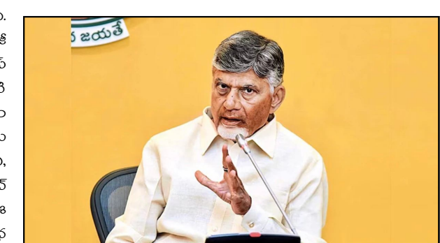
వర్క్ షాప్ లో మొదటిరోజు కార్యదర్శులు, రెండోరోజు విభాగాధిపతులు హాజరయ్యారు.

మెరుగైన ఫలితాలు సాధించడంపై ప్రధానంగా చర్చ జరిగింది. గ్రామ స్థాయి నుంచి రాష్ట్ర స్థాయి వరకు పౌర సేవల్లో టెక్నాలజీ వాడకం, ప్రస్తుతం అనుసరిస్తున్న విధానాలు, వచ్చే ఫలితాలపై కేస్ స్టడీస్ పరిశీలన జరిగింది. ఏయే విభాగాల్లో ఎటువంటి సాంకేతికతను వినియోగించవచ్చు, ప్రస్తుతం ఉన్న సమాచారం ఆధారంగా సేవల్ని ఎలా విస్తృత పరచవచ్చు అనే దానిపై నిపుణులు ప్రజాభిప్రాయం ఇచ్చారు. ఏవ, ఎంఎల్, డిఎల్, చాట్ జీఏటీ, జెమిని, డేటా డ్రైవ్, ఎవిడెన్స్ బేస్ గవర్నెన్స్ ఏవ ప్లేమిక్, ఏవ బేస్ పైలెట్ ఐడియాస్ వంటి అంశాలపై ప్రత్యేక సెషన్స్ నిర్వహించనున్నారు. ఈ సందర్భంగా వ్యవసాయం, విద్య, వైద్య పట్టణాభివృద్ధి సహా వివిధ రంగాల్లో నూతన సాంకేతిక పరిజ్ఞానం వినియోగాన్ని పలువురు నిపుణులు వివరించనున్నారు. రెండు రోజుల పాటు కొనసాగుతున్న