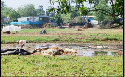
అమ్మకోవడానికి కూడా పరిస్థితి లేదు అంటూ రైతులు తీవ్ర ఆవేదన వ్యక్తం చేస్తున్నారు

రాయల్ జర్నలిజం(పిట్టలవానిపాలెం) ఏప్రిల్ 04 :పిట్టలవానిపాలెం మండలం కొత్తపాలెం గ్రామంలో శుక్రవారం అర్ధరాత్రి కురిసిన వర్షం రైతులను తీవ్రంగా నష్టపరిచింది. కోత అనంతరం కళ్లాల్లో అరబోసిన ధాన్యం పూర్తిగా తడవడంతో, రైతులు తీవ్ర ఇబ్బందులను ఎదుర్కొంటున్నారు. రాత్రి వర్షం, అకస్మాత్తుగా పడడంతో ధాన్యాన్ని కాపాడే అవకాశం లేకుండా పోయింది. ధాన్యం పూర్తిగా తడిసి, తేమ పెరిగిపోవడంతో దానికి మృత్యుదండం రావడం కూడా అనుమానంగా మారింది. రైతులు తడిసిన ధాన్యాన్ని ఎత్తేందుకు, వేరు చేసేందుకు తీవ్ర శ్రమ పడుతున్నారు. మట్టితో కలిసిపోయిన ధాన్యాన్ని బస్తాల్లో వేసి ఎండబెట్టడం కూడా పెద్ద సవాలుగా మారింది.రైతులు ప్రభుత్వం తడిసిన ధాన్యాన్ని తగిన ధరకు కొనుగోలు చేయాలని, నష్టపరిహారం అందించాలని డిమాండ్ చేస్తున్నారు. రుణాలు చేసి పంట పండించాం. ఇప్పుడు ధాన్యం పూర్తిగా తడవడంతో