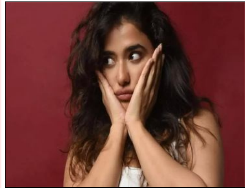
ఊపులో మరో సినిమా అవకాశం అందుకుని అది కూడా సక్సెస్ కొడితే మాత్రం ఇక అమ్మడికి టాలీవుడ్ కెరీర్ కి ఇబ్బంది ఉండదని ఫిక్స్ అవ్వచ్చు.