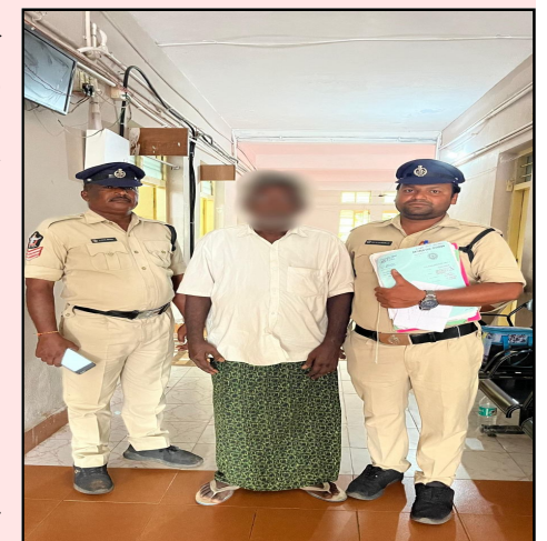
మహిళల మీద నేరం జరిగితే వేగంగా దర్భాప్తు చేసి పీపీని జిల్లా ఎస్పీ ప్రత్యేకంగా అభినందించారు.

నిర్జిత గదువులోపు సంబంధిత కోర్ట్ లలో ఛార్జ్ షీట్ దాఖలు చేసి, కోర్ట్ లో జరుగుతున్న విచారణను ఎప్పటికప్పుడు పర్యవేక్షించుకుంటూ, సాక్షులకు తగిన రీతిలో భయం లేకుండా సాక్ష్యం చెప్పే విధంగా తర్పీదు ఇవ్వడం వలనే కేసులలో నిందితులకు శిక్షలు పడుతున్నాయన్నారు. మహిళలపై జరిగే నేరాల మీద ప్రత్యేక దృష్టి సారించి కోర్టు టైల్ మానిటరింగ్ నిర్వహించడం జరుగుతుందన్నారు. అందువల్లనే ఏ కేసులోను ముద్దాయి తప్పించుకొనే లేకుండా బలమైన సాక్షాలను న్యాయస్థానం ముందు ఉంచగలుగుతున్నామన్నారు. మహిళల మీద బాలికల మీద చెడు ఉద్దేశంతో బ్రవర్తించేవారిని ఉపేక్షించేది లేదని తెలిపారు. ప్రత్యేక ఒంగోలు ఫోక్స్ కోర్టు న్యాయమూర్తి వెలువరించిన తీర్పు నిదర్శనమని పేర్కొన్నారు. కేసు దర్యాప్తు వేగవంతంగా చేసి, ముద్దాయిని అరెస్ట్ చేసి, భౌతిక సాక్షాదారాలను కోర్టు వారికి సమర్పించి, డ్రుత్యేక ఫోక్స్ కోర్ట్ లో వేగవ ంతంగా ట్రయిల్ జరిగేవిధంగా పర్వవేక్షించుకుంటూ నేరం జరిగిన 18 నెలలోపే ముద్దాయికి కఠిన