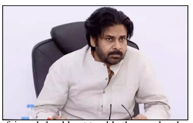
fair and should not trouble the people who depend on it, the communication from the DCM's office read.

Andhra Pradesh, deputy chief minister, cians in the Telugu film industry faced a act with bias or personal revenge. But the previous government targeted individuals. They created problems for films of people they didn't like sometimes even sent officials like Tahsildars to theatres during releases to cause trouble. How can producers forget this?In contrast, the current coalition government has shown that it treats everyone equally. For example, even when a film related to Akkineni Nagarjuna's family released, the Andhra Pradesh government supported it properly. The coalition believes the system must be