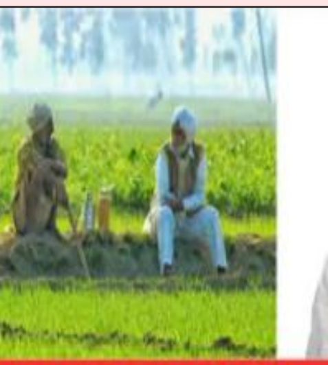
Annadata Sukhibhava Scheme

అమరావతి : ఆంధ్రప్రదేశ్ రాష్ట్రంలో రైతాంగం అన్నదాత సుఖీభవ కోసం ఎదురుచూస్తుంది. ఇక ఇదే క్రమంలో ఏపీ ముఖ్యమంత్రి చంద్రబాబు తాజాగా రైతులకు శుభవార్త చెప్పారు. ఈ నెలలోనే అన్నదాత సుఖీభవ పథకాన్ని ప్రారంభిస్తామని చంద్రబాబు వెల్లడించారు. ఎంపీలు, ఎమ్మెల్యేలు పార్టీ కార్యవర్గంతో టెలి కాన్ఫరెన్స్ నిర్వహించిన చంద్రబాబు రాష్ట్రంలో అమలు చేస్తున్న సంక్షేమ పథకాల గురించి కీలక విషయాలను వెల్లడించారు. పార్టీ నేతలకు చంద్రబాబు కీలక ఆదేశాలు జూన్ 12 కి కూటమి ప్రభుత్వానికి ఏడాది పూర్తివుతుందని ఇప్పటివరకు చేసిన సంక్షేమ, అభివృద్ధి కార్యక్రమాలను ప్రజలలోకి తీసుకువెళ్లాలని చంద్రబాబు సూచించారు. కూటమి ప్రభుత్వం ఏ మంచి చేసిన ఓర్వకొలేని వైసీపీ నేతలు చౌకవారు విమర్శలు చేస్తున్నారని వాటిని తిప్పి కొట్టాలని పిలుపునిచ్చారు. అన్నదాత సుఖీభవ అమలుకు ముహూర్తం ఫిక్స్ ఎన్నికల సమయంలో ఇచ్చిన హామీల అమలులో భాగంగా అన్నదాత సుఖీభవ పథకం అమలుకు ముహూర్తం ఖరారు చేసిన చంద్రబాబు ఇంకా ఎంతో కాలం నిరీక్షించాల్సిన అవసరం లేదని తాజా ప్రకటనతో స్పష్టం చేశారు. గతంలో ఎన్నికల సమయంలో కూటమి ప్రభుత్వం అధికారంలోకి వస్తే ప్రతి రైతు ఖాతాలో 20000 జమ చేస్తామని చెప్పిన చంద్రబాబు, ఇచ్చిన