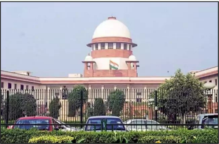
దాఖలైన పిటిషన్లను కూడా సర్వోన్నత న్యాయస్థానం అవసరమని కోర్టు నొక్కొ చెప్పింది.

సున్నితత్వం మీకు అర్థం కావడం లేదా? ఈ పిటిషన్ దాఖలు చేసినందుకు మీకు భారీ జరిమానా విధించాల్సి వస్తుందని మేము భావిస్తున్నాము" అని జస్టిస్ సూర్య కాంత్ వ్యాఖ్యానించారు. దీనిపై పిటిషనర్ స్పందిస్తూ, జమ్మూ కశ్మీర్ లో పర్యాటకులను లక్ష్యంగా చేసుకోవడం ఇదే మొదటిసారి, అందుకే వారి భద్రత కోసం ఆదేశాలు కోరుతున్నారని తెలిపారు. అయితే, ధర్మాసనం పిటిషనర్ వాదనతో ఏకీభవించలేదు. "పిటిషనర్ ఒకదాని తర్వాత ఒకటిగా ప్రజా ప్రయోజన వ్యాజ్యాలు దాఖలు చేస్తున్నారు, వీటి వెనుక అసలు ప్రజా ప్రయోజనం కంటే ప్రచార ఆర్జాటమే ప్రధానంగా కనిపిస్తోందని" తమ ఉత్తర్వుల్లో పేర్కొంది. ఇటీవల జమ్మూ కశ్మీర్ లోని పెహలామల్ జరిగిన ఘోర ఉగ్రదాడిపై సుప్రీంకోర్టు లిబర్టీ న్యాయమూర్తి పర్సవేక్షణలో న్యాయ విచారణ జరపాలని కోరుతూ