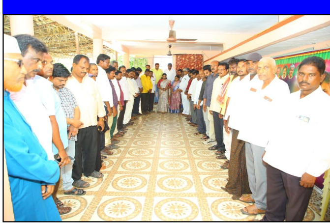
సందిగామ జూన్ 13 :అవ్వరాబాద్ నుండి లండన్ వెళు

ఏపీ ప్రభుత్వ ఏవ్, ఎమ్మెల్యే తంగిరాల సౌమ్య