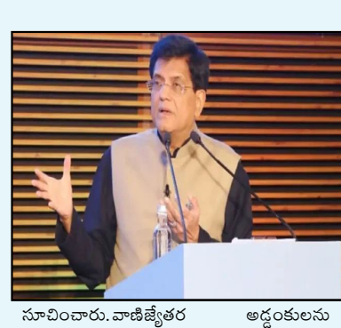
సూచించారు. వాణిజ్యోత్తర అడ్డంకులను

న్యూఢిల్లీ : సుకాలత్ సరిబంధం లేకుండా ఎదురవుతున్న వాణిజ్యసంఘటన అడ్డంకులను తొలగించాలని ప్రపంచ వాణిజ్యసంఘటన కేంద్ర వాణిజ్యశాఖ మంత్రి పీయూష్ గాంధీ పిలుపునిచ్చారు. అసమాన వాణిజ్య విధానాలను సరిదిద్దాలని, బలమైన విచార పరిష్కార వ్యవస్థను పునరుద్ధరించాలన్నారు. తక్కువ అభివృద్ధి చెందిన, అభివృద్ధి చెందుతున్న దేశాలకు ప్రత్యేక ప్రాధాన్యం ఇవ్వాలన్నారు. గత మంత్రివర్గ సమావేశాల్లో ముగింపు దశకు వచ్చిన అంశాలపై డబ్బూటీటీఆర్ దృష్టిసారించాలని