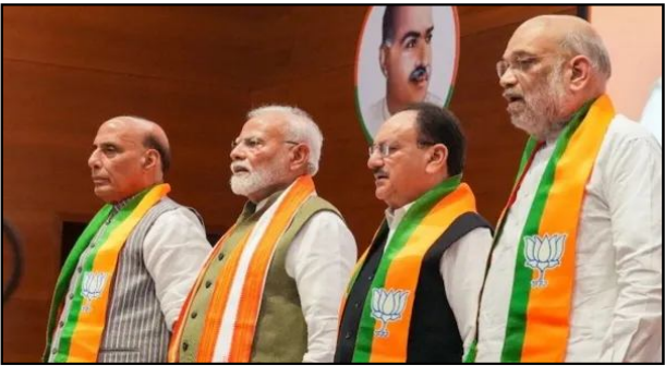
Yogi Adityanath regarding potential candidates. Suggestions for Dalit and OBC faces have been sought, but Amit Shah and Prime Minister Narendra Modi will make the final decision.

joint general secretaries. Sources indicate that BJP leadership might discuss with RSS functionaries during this meeting to potentially finalise the next party chief. The BJP aims to complete state-level appointments first, especially in key states like Uttar Pradesh, Gujarat, Madhya Pradesh, Karnataka, Maharashtra, and West Bengal. This approach is intended to convey internal consensus before deciding on national leadership. In Uttar Pradesh, caste equations complicate the selection process. Discussions have occurred between Defence Minister Rajnath Singh and Chief Minister